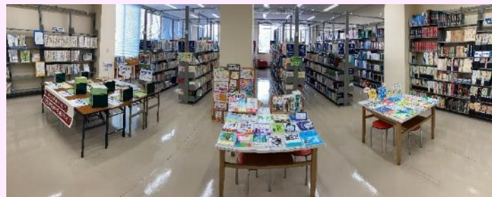
【1万冊以上の教育図書を配架】