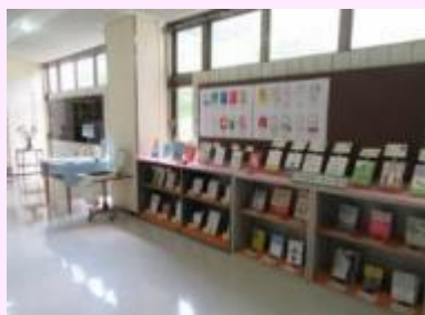
【玄関のおすすめ書籍】